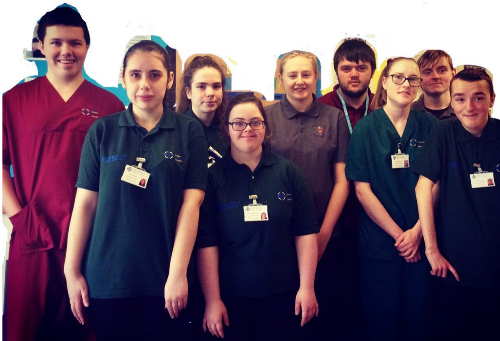
Llun o interniaid 'Engage to Change Project SEARCH' yn Ysbyty Gwynedd, Bwrdd Iechyd Prifysgol Betsi Cadwaladr.

Rhaglen interniaeth blwyddyn o hyd yw DFN project SEARCH sy'n cefnogi pobl ifanc sydd ag anabledd dysgu i ddatblygu y sgiliau a'r profiad sydd ei angen o fewn gwaith cyflogedig.