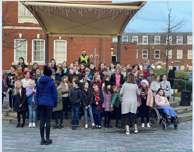
Gwirfoddolwyr disgyblion blwyddyn 5 a 6 yn canu yn y dref. Volunteers for years 5 and 6 singing in town.