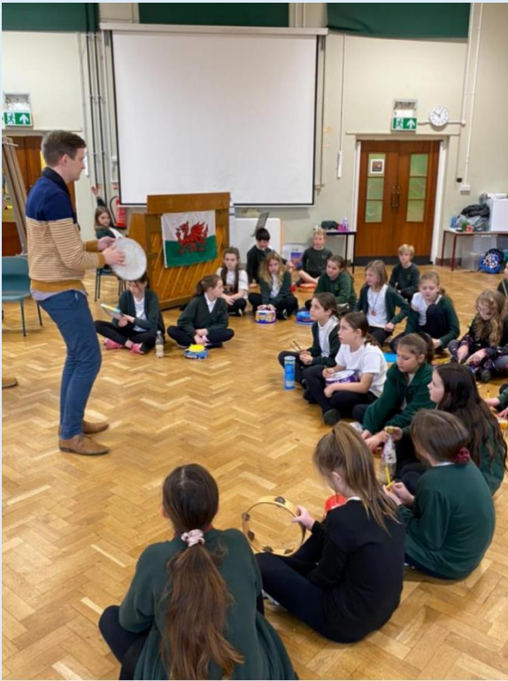
Blwyddyn 5 a 6 Gweithdy cerddorfa ailgylchu- Recycled Orchestra workshop