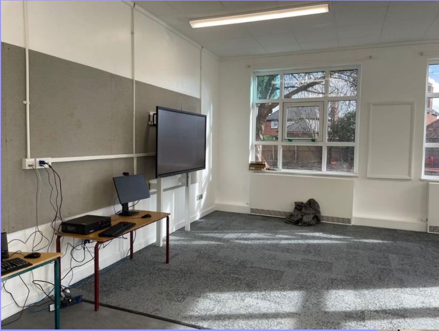
Rhan 2/Phase 2