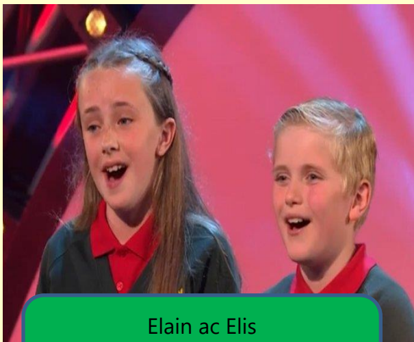
Elain ac Elis 2il Deuawd Blwyddyn 6 ac iau