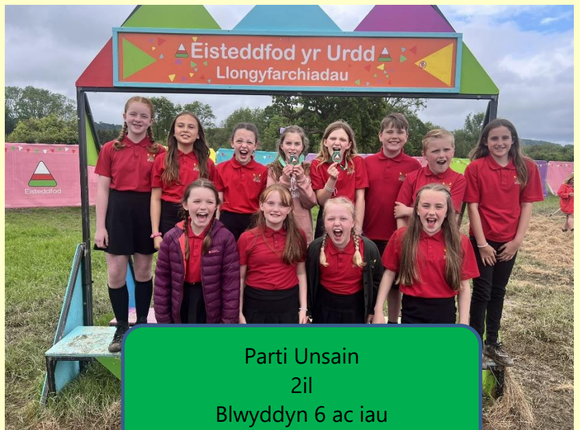
Parti Unsain 2il Blwyddyn 6 ac iau

Canlyniadau Celf a Chrefft 2024 | Ychwanegu