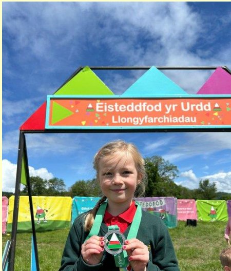
Alaw 2il Unawd Cerdd Dant Blwyddyn 2 ac iau